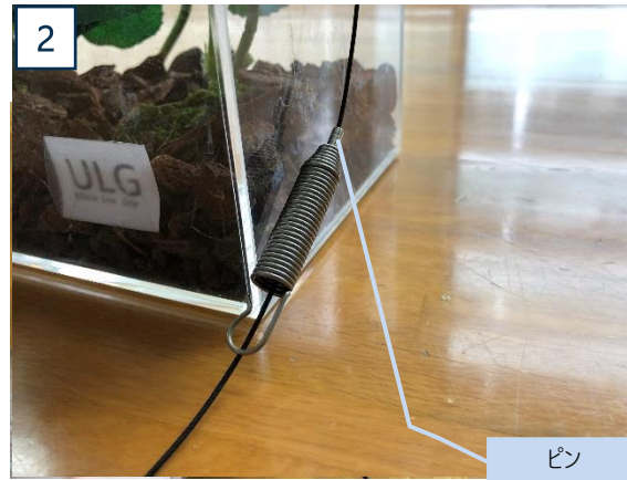
バネ部先端のピンへワイヤーを差し込む