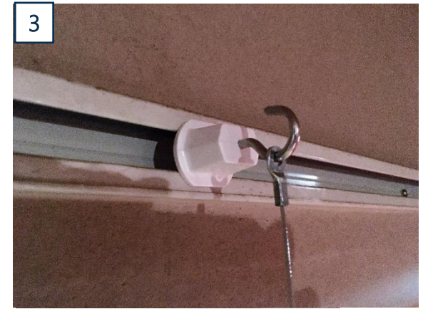
ライティングレールに既製フックを取付け、ワイヤーを引っ掛けます。 ※フックの角度によって、取付位置は変わります