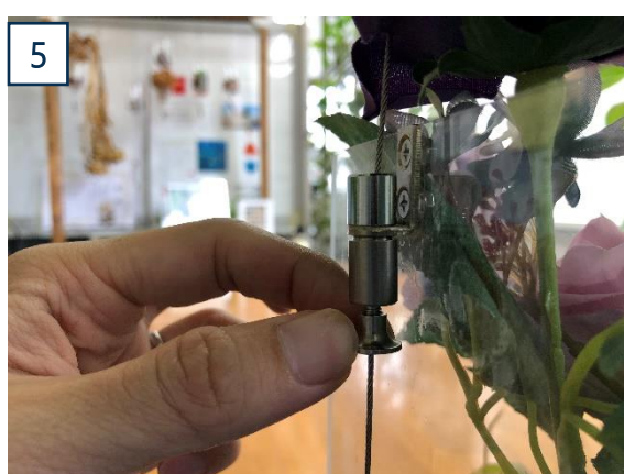
下方へは、ハンギングケース側面部に取り付けられているパーツを下に引きながら降ろします。 手を放した位置でロックします。