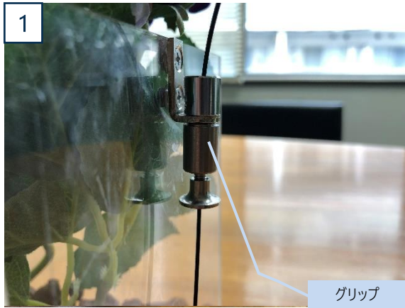
ハンギングケースのグリップにワイヤーを差し込む

ライティングレールに既製フックを取付け、ワイヤーを引っ掛ける事でハンギングアイテムを吊るす事が出来ます。 ただし、ライティングレールに記載されている耐荷重を必ずご確認ください